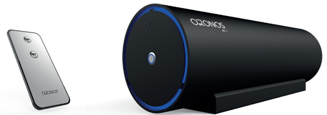
Abbildung 1: Remote Control